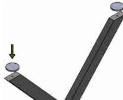
Bodengleiter fertig montiert