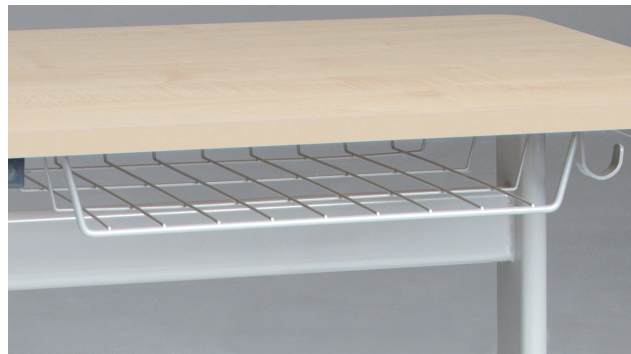
Drahtkorbbablage als Zubehör bestellbar