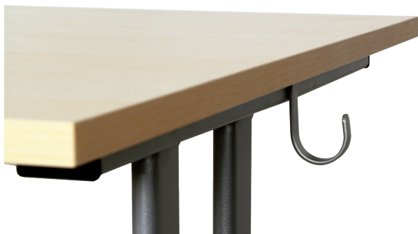
Taschenhaken als Zubehör bestellbar