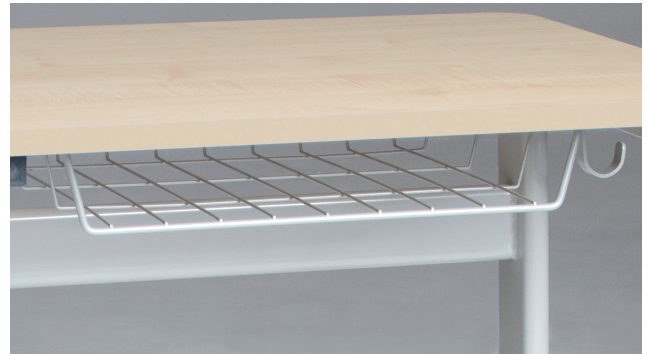
Drahtkorbbablage als Zubehör bestellbar